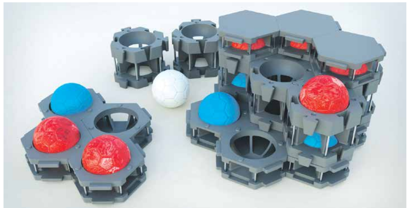
Funtzio askotako kaiola, moduluduna, Boccia kiroleko bolak gorde edota harrapatzeko

pertsonentzat diseinatutako jokoa; plastikozko atzamar-ferula zurruna / irmoa, atzamarren azken falangea ez dadin tolestu; egokitzailea / gida / posizionatzailea / besoen ferula, umeei golfean jokatzen laguntzeko; erabilera askotako heldulekua; ortesi antiiekinoia eta plataforma egokitua, atzazalak mozteko gailua erabiltzeko.