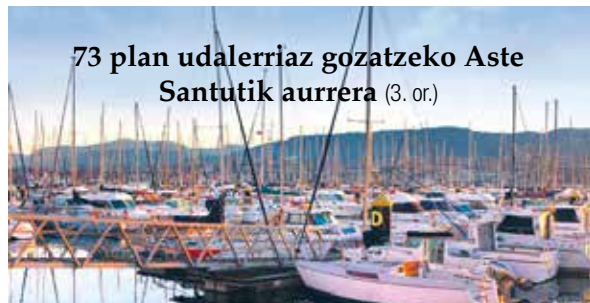
73 plan udalerriaz gozatzeko Aste Santutik aurrera (3. or.)