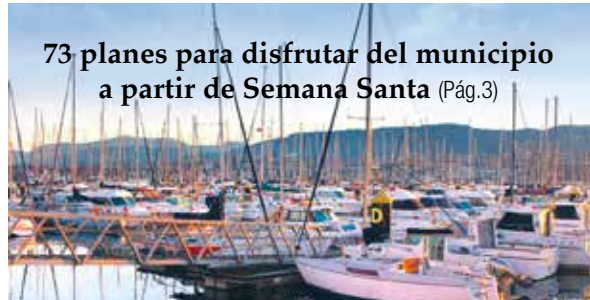
73 planes para disfrutar del municipio a partir de Semana Santa (Pág.3)