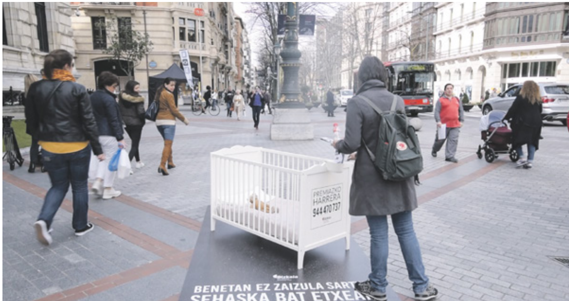
Kanpainako ekintza bat Bilboko Gran Vian

Getxoberri Getxoko Udaleko Komunikazio Sailak kaleratutako argitalpena da eta horretan udalari eta tokiko bizitza-ri lotutako albisteak eta informazioak agertzen dira astero. Komunikaziozko zinegotzia: Amaia Agirre . Zuzendaria: Javier García . Erredaktoreburua: Itziar Aguayo . Erredakzioa: Nekane Ardanza , Monika Rodrigo, Iñigo Olondo . Urgull kalea z.g., 4. Tel.: 94 466 03 20. 48991 Getxo. e-posta: getxoberri@getxo.eus Arte arduradunak: Flash Composition SL Inprimaketa: Editorial Iparraguirre S.A. Banaketa: Lantegi Batuak Fundazioaren egunOn zerbitzua Gordailu legala: BI-388-87