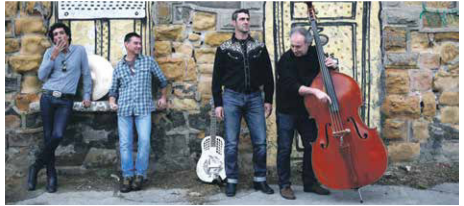
The Blues Morning Singers

barik. Sarreraren prezioa 10€koa ere izango da.