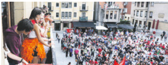
Motorrak berotzen San Inazio eta Romoko jaietarako (3. eta 4.or.)

Letren Terrazak. Hilaren 27an, osteguna, eta 28an, ostirala, Andra Mariko Sarri plazan, 19:00etan, eta Algortako Iturgitxi plazan 12:30ean, hurrenez hurren, Ipuin kontaketa.