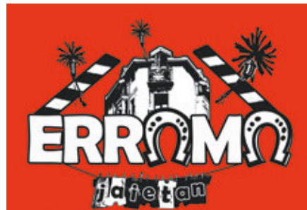
Arkaitz Tato, banderaren diseinuaren irabazlea

Txikienek Txikigunearekin gozatu ahal izango dute, oraingoan Geltokia plazan, abuztuaren 2an, 3an, 4an eta 5ean; eta baita ostiralean, abuztuak 4, 13:30ean Muztio Rallyarekin, eta abuz-