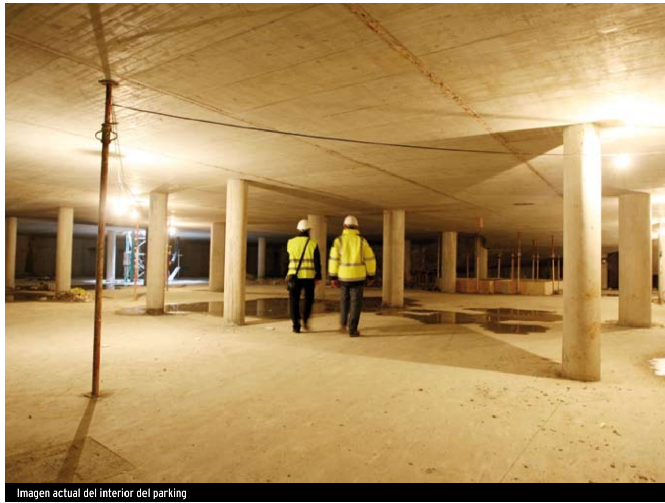
Imagen actual del interior del parking

En los próximos meses se darán a conocer las condiciones administrativas y procedimiento para la concesión de las plazas de aparcamiento de las que se informará puntualmente a los vecinos y vecinas de Getxo residentes en el área de influencia que se defina.