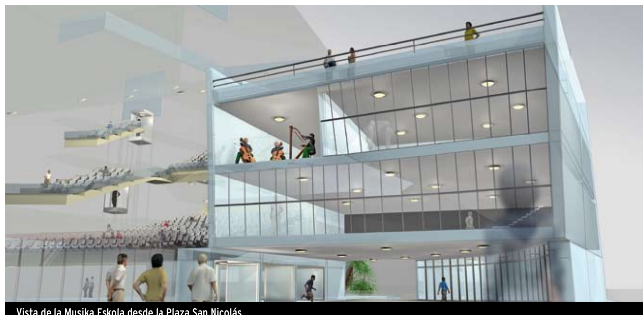
Vista de la Musika Eskola desde la Plaza San Nicolás

La práctica de música en conjunto como uno de los ejes vertebradores de la enseñanza musical: banda, orquesta de cuerda, fanfarria e instrumentos de raíz tradicional, combo, coro, agrupaciones diversas de música de cámara... caracterizan también la oferta de enseñanza.