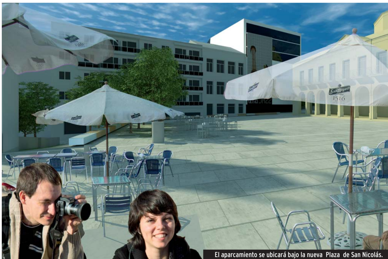
El aparcamiento se ubicará bajo la nueva Plaza de San Nicolás.