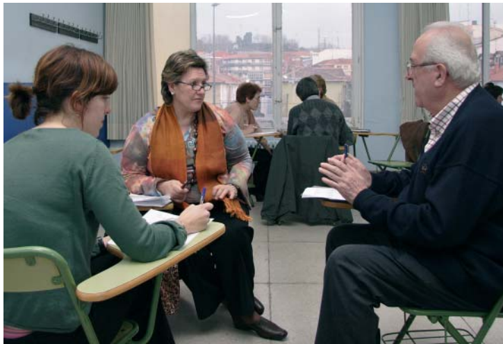
Taller para la elaboración del Decálogo.

Para terminar, recalcan que el problema de los cuidados de personas en situación de dependencia atañe a todas y a todos los getxotarras, por lo que animan al resto del vecindario a participar en este “movimiento ciudadano social, exento de etiquetas”.