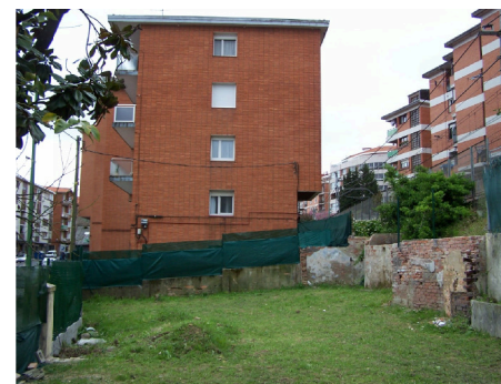
PORTAL Nº17 (DEMOLIDO)