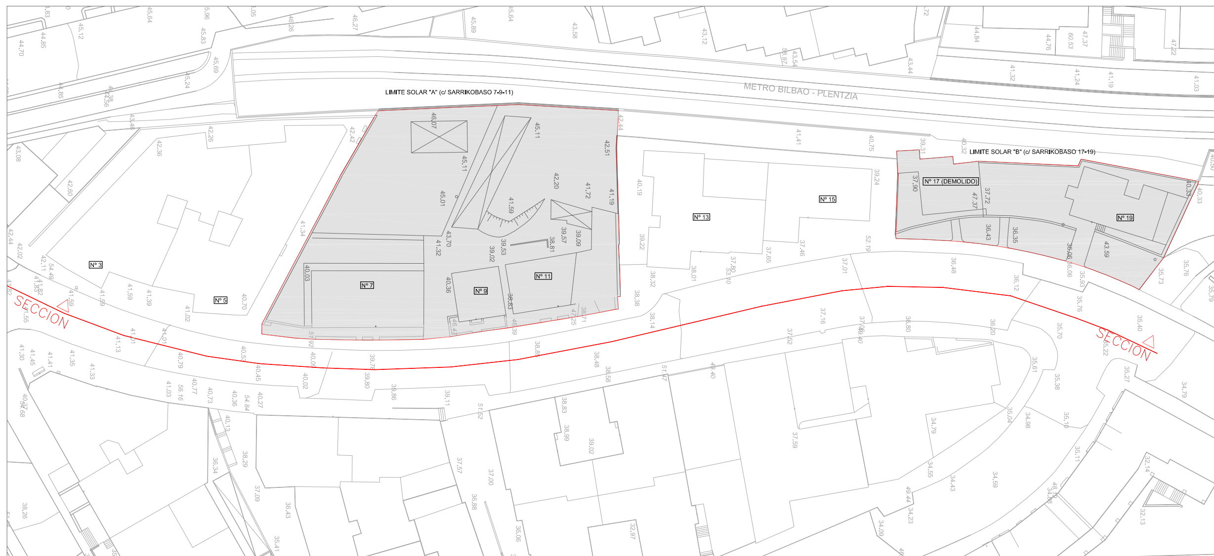
DELIMITACION DE SOLARES