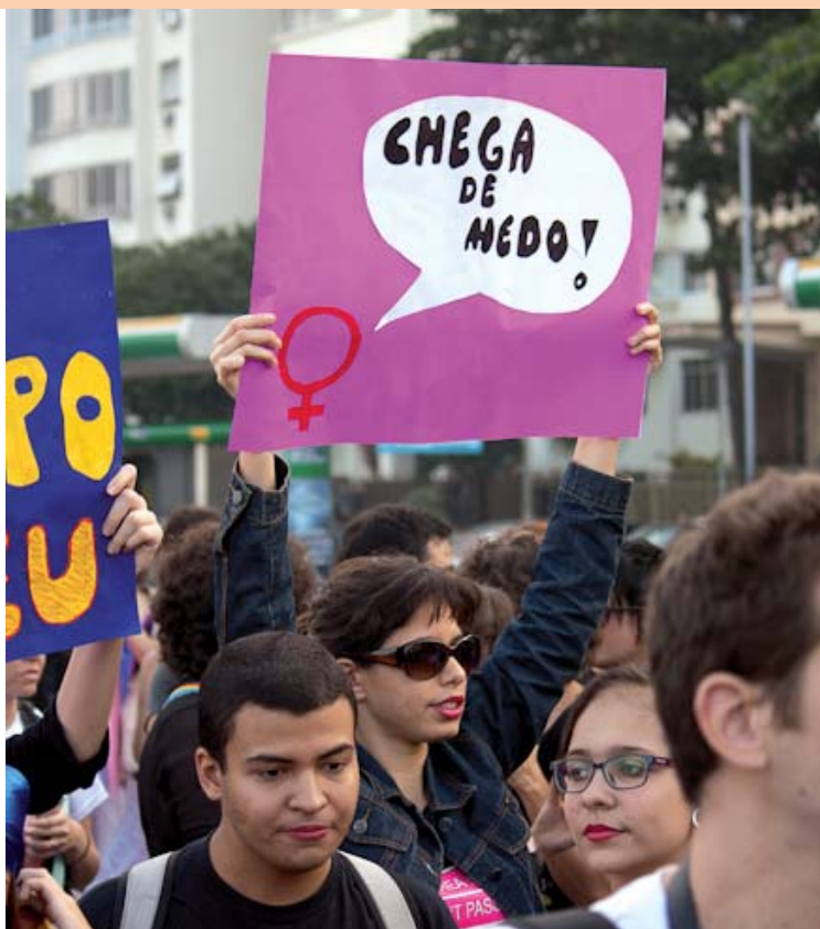
Marcha de prostitutas en Brasil donde una mujer lleva un cartel que se lee "llena de miedo".

El sociólogo Pierre Bourdieu definió como violencia simbólica aquella que no es física, sino tan sutil e invisible que pasa desapercibida hasta para las personas que la sufren. Es un concepto aplicable a los diferentes sistemas de domina-